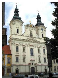
Uherské Hradiště kostel Svatého Františka Xaverského