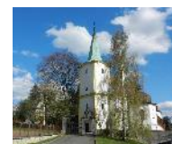
Lešná u Valašského Meziříčí kostel sv. Archanděla Michaela

Po až So 10–12 a 13–17 hod. Ne 13–17 hod.