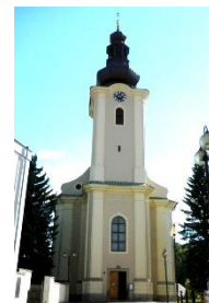
Rožnov pod Radhoštěm kostel Všech svatých