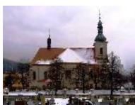
Střilky kostel Nanebevzetí Panny Marie