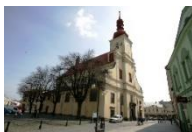
Holešov farní kostel Nanebevzetí Panny Marie