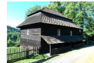
Velká Lhota Toleranční kostel Českobratrské církve evangelické