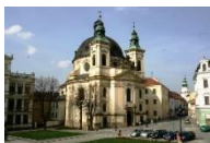
Kroměříž kostel sv. Jana Křtitele