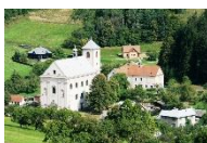
Rajnochovice kostel Narození Panny Marie

Út až So 10–12 a 13–17 hod. Ne 13–17 hod.