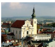
Kroměříž kostel Nanebevzetí Panny Marie

Út až So 10–12 a 13–17 hod. Ne 13–17 hod.