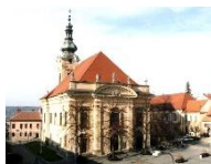
Uherský Brod kostel Neposkvrněného početí Panny Marie