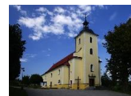
Francova Lhota kostel sv. Štěpána Uherského