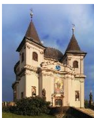
Svatý Hostýn bazilika Nanebevzetí Panny Marie Svatohostýnské