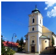
Holešov kostel sv. Anny