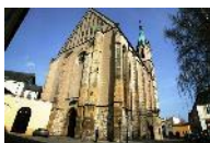
Kroměříž kostel sv. Mořice

Út až So 10–12 a 13–17 hod. Ne 13–17 hod.